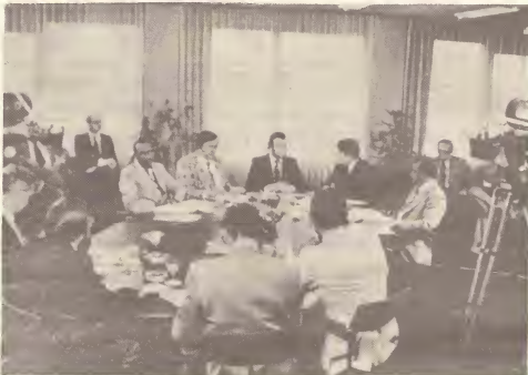
Representantenan di Aruba na Hulanda durante September 1977 despues di accionnan.

Un otro factor cu a reñforza e lucha pa independencia ta e estudio haci door di e institucion independiente di Hulanda, esta I.S.S., cual ta demostra cu Aruba por bira independiente. Tambe e informe di I.S.S. ta comproba cu Aruba ta e boca di lechi di Antillas pasobra ta scribi den e informe cu Aruba ta subsidia Corsow y e otro islanan y cu Aruba ta tumando e pasonan correcto.